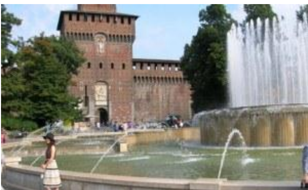
Kirjastovierailu Milanon IFLAssa.