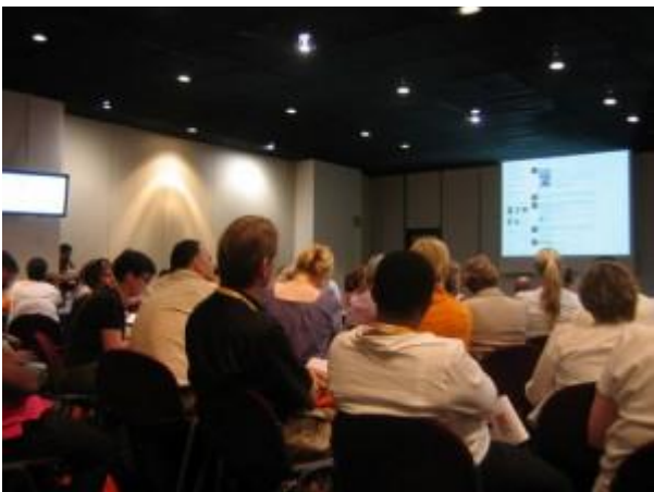
Konferenssiyleisöä Milanon IFLAssa.

Yliopistokirjastoilta kysyttiin myös, kuinka niissä on valmistauduttu tulevaan IFLAan ja miten laajasti kirjastoissa aiotaan osallistua. Kaikki kirjastot aikovat osallistua ja lähettää konferenssiin kirjastonsa väkeä. Arviot henkilömääristä vaihtelivat yhdestä hengestä useampiin kymmeneen kirjastosta riippuen. Kuusi yliopistokirjastoa on mukana järjestämässä prekonferenssia ja yksitoista on kirjastovierailun kohteena. Helsingin IFLAa selvästi odotetaan. Tällä hetkellä on käynnissä haku esiintyjäksi tai posterin esittelijäksi.